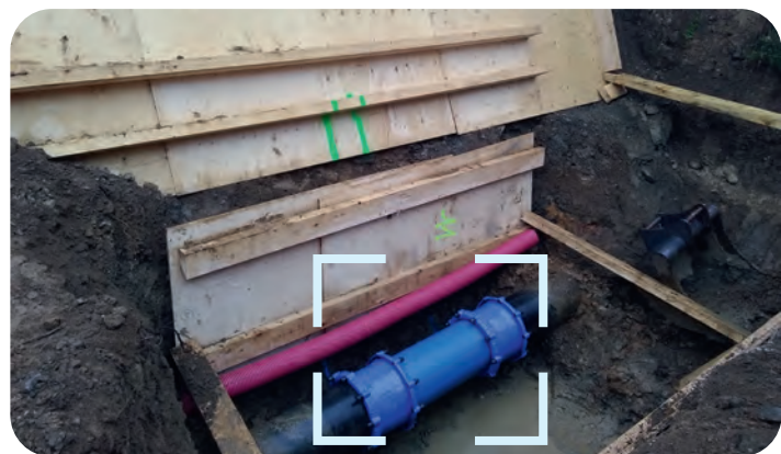
Réparation de la conduite et remise en eau – 06/07/2021