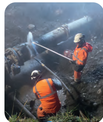
Vanne défectueuse (à gauche), et mise en vidange du feeder (23h).