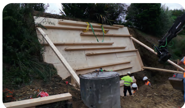
Terrassement et sécurisation de la fouille – 02/07/2021