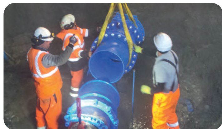
Mise en place des pièces de raccord et de la nouvelle robinetterie (2h30)