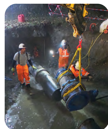
Début de découpe du feeder (00h30), et démontage de la vanne.