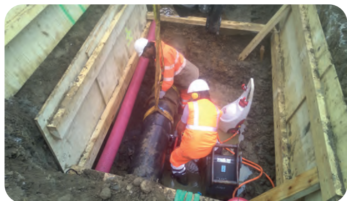
Découpe du tronçon de conduite fuyard – 06/07/2021