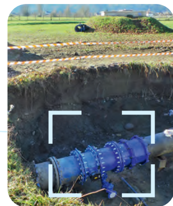
Remise en eau du feeder (4h30), et retour à la normale au petit matin.

* Le feeder est un réseau principal sur lequel sont raccordés les puits de production d'eau.