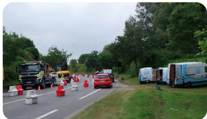
Installation et mise en sécurité du chantier – 01/07/2021

Réparation d'une fuite sur la canalisation en fonte de 400 mm de diamètre, en bordure de rocade à Mazères-Lezons, début juillet 2021 :