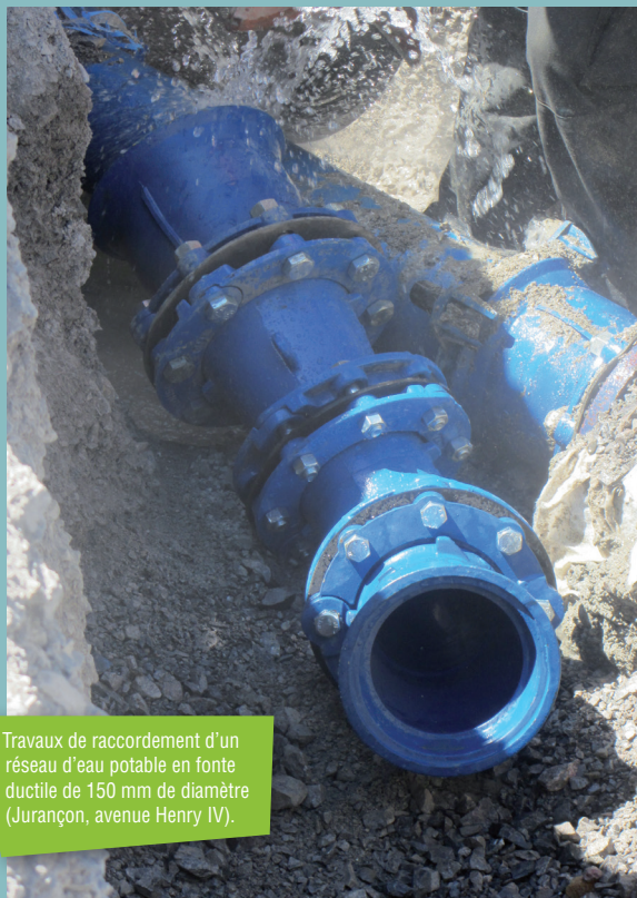
Travaux de raccordement d'un réseau d'eau potable en fonte ductile de 150 mm de diamètre (Jurçon, avenue Henry IV).

5% des charges. L'essentiel du budget est ainsi consacré aux dépenses d'investissement telles que le renouvellement des réseaux (90 % des travaux financés en 2016), et la réhabilitation des réservoirs, bâches ou puits de production d'eau (10 % de l'investissement 2016).