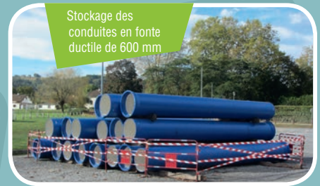
Stockage des conduites en fonte ductile de 600 mm