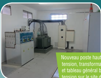
Nouveau poste haute tension, transformateur et tableau général basse tension sur le site dit de « Mazères II ».

Afin de se prémunir des risques d'inondation, ErDF, le SIEP et son exploitant ont engagé des travaux de mise hors d'eau et de sécurisation ou de modernisation des points de distribution d'électricité des puits à Mazères-Lezons. Les travaux réalisés sur la haute tension et la basse tension ont représenté un investissement de près de 140 000 € pour le SIEP, de 80 000 € pour ErDF et d'environ 65 000 € pour l'exploitant SOBEP / Lyonnaise-des-Eaux.