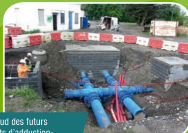
Le nœud des futurs départs d'adduction-distribution en sortie du champ captant