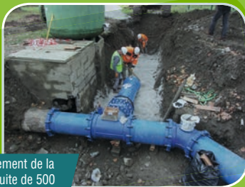
Té de raccordement de la nouvelle conduite de 500 mm en sortie des puits de production d'eau potable

L'opération a consisté à déplacer des conduites existantes afin de permettre la réalisation future d'une digue de protection vis-à-vis des crues du gave de Pau sur la commune de Mazères-Lezons. Les travaux, dont le coût avoisine les 515 000 €, ont été également l'occasion de doubler la conduite existante en fonte de diamètre 500 mm et de renouveler en partie la conduite principale d'alimentation des communes du SIEP situées en rive droite du gave de Pau.