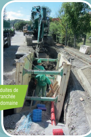
Pose des conduites de 600 mm en tranchée blindée sous domaine public

Le SIEP tient à remercier la commune, les usagers et les riverains de la rue du 8 Mai 1945, pour leur collaboration active et leur mansuétude dont ils ont fait preuve tout au long des travaux.