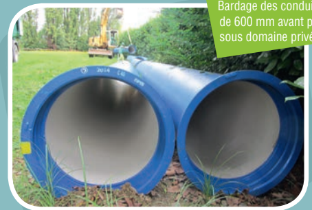
Bardage des conduites de 600 mm avant pose sous domaine privé