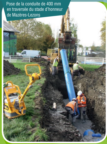
Pose de la conduite de 400 mm en traversée du stade d'honneur de Mazères-Lezons