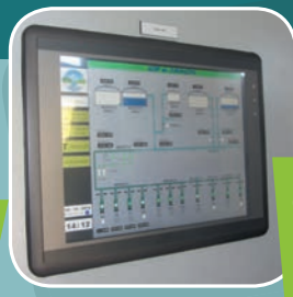
Détail de l'écran de supervision des puits et des principaux réservoirs du SIEP.