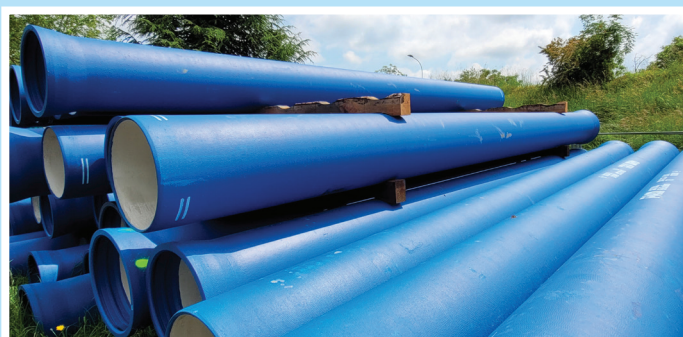
Conduites en Fonte de 400 et 600 mm avant pose.

Les travaux, d'un montant de près d'1 million d'euros , se sont déroulés entre avril et juin 2023, dont un mois de nuit pour ne pas entraver la circulation de la rocade.