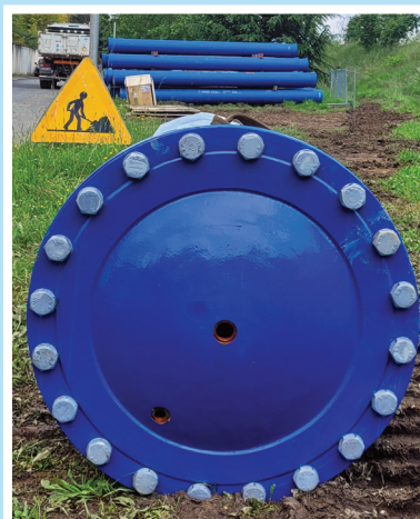
Plaque pleine sur conduite en Fonte de 600 mm de diamètre.