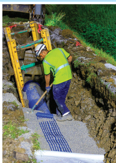
Remblaiement de la tranchée.