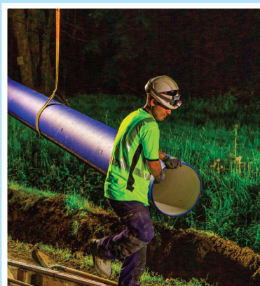
Manutention de la conduite.