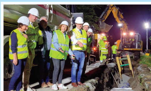
Visite de chantier des élus.