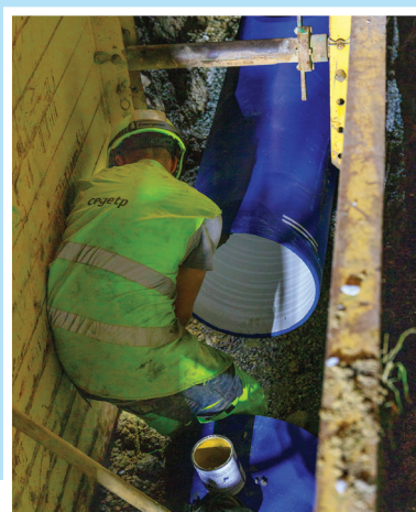
Pose de la conduite en fond de tranchée.