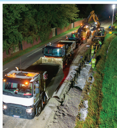
Chantier nocturne bord de rocade.